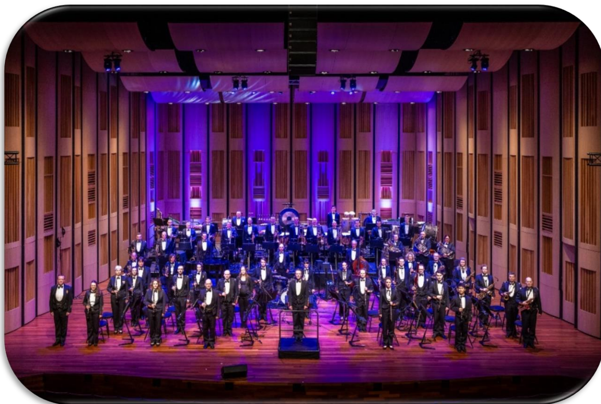
Vereniging van Vrienden Koninklijke Militaire Kapel 'Johan Willem Friso' (KMKJWF) Regimentsfanfare 'Garde Grenadiers en Jagers' (RFGGJ)

De KMKJWF en wij hopen vele Vrienden te mogen begroeten.